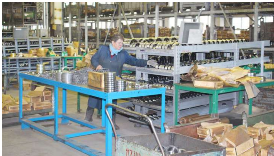
Сборочный участок ЦМиСП

А в России спрос и на эту продукцию, и на подшипники, которые традиционно выпускало наше предприятие, но в свое время прекратило их производство, по-прежнему высок. К тому же, доверие к нашему заводу в РФ все еще очень велико.