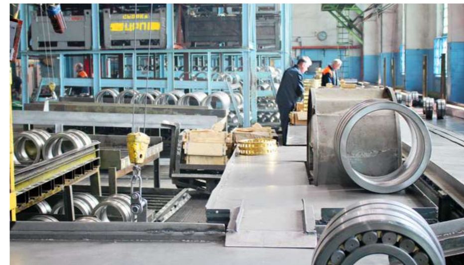
Сборочный участок ЦРП. Большим подшипникам - большие пространства

Если получится реализовать всё задуманное, то, по мнению генерального директора нашего завода, к концу первого полугодия МПЗ сможет выйти на месячный объем производства на уровне 7 млн. руб. (при нынешних 4-х млн.).