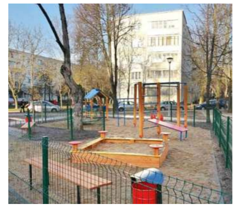
Благоустройство дворовой территории

В прошлом году заменено 3270 светильников на энергосберегающие,