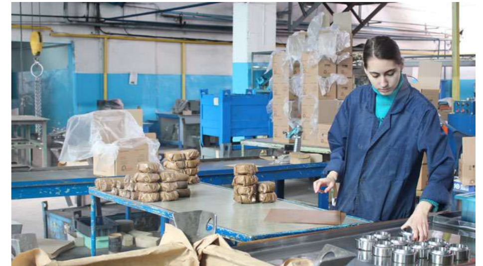
Сборочный участок ЦШИП. Упаковка готовой продукции перед отправкой

Мы не только усилим внимание к роликоферическим подшипникам, но и начнем возрождение производств, которые были закрыты как нерентабельные, а также станем налаживать новые.