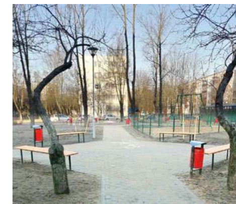
Благоустройство дворовой территории по ул. Ташкентская № 20/2

По итогам 2020 года в Заводском районе не останется ни одного старого лифта, все будут заменены на новые.