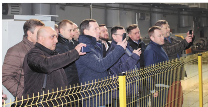
Представители ТПС активно фотографируют работу «Мураро»

В завершении совещания представителям ТПС были вручены дистрибьюторские сертификаты на 2019 год, подтверждающие их право реализовывать продукцию МПЗ.