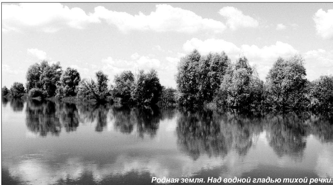
Родная земля. Над водной гладью тихой речки.